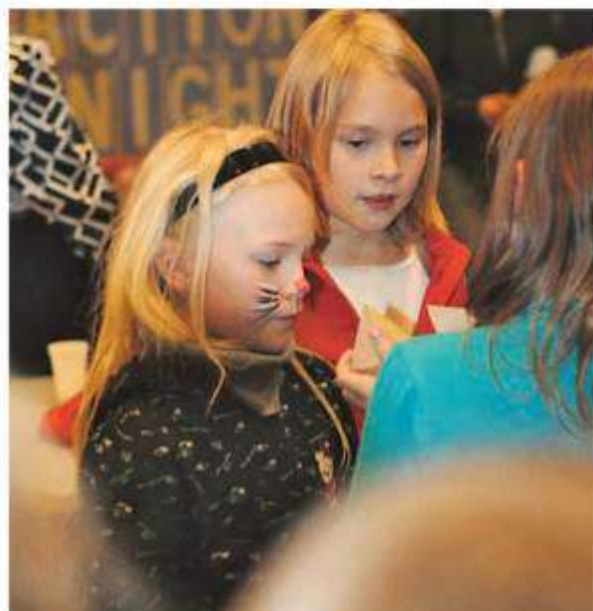
Kasvomaalauksia on jännää kokeilla.

– Kristityt eivät useinkaan ajattele yleviä Hitleristä, kommunistihallinnosta tai islamistiaktiiviteista. Vaan entäpä jos kuitenkin joudumme nostamaan heille hattua? Hitler ei ainoastaan kannattanut lapsityötä, vaan hän myös teki sitä. Hitlerin kerrotaan tarjonneen lapsille lauluja, retkiä, värikkäitä lippuja ja leirinuotioita. Lapset olivat innoissaan, ja seuraukset tehokkaasta lapsityöstä me tiedämme.