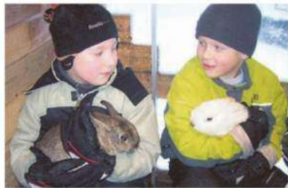
Kanit Viiru ja Sokeri poikien syleilyssä.