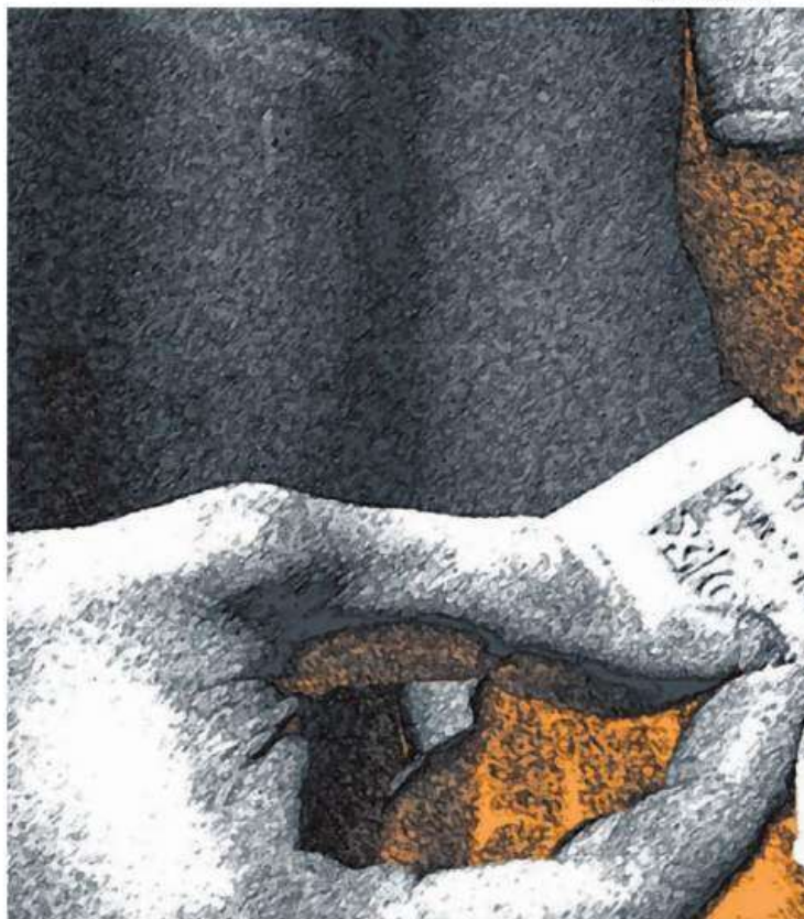
Ongelmapelaaja toivoo aina suurta voittoa, jolla kuitata aiemmat tappiot. Vaikka sellainen kohdalle sattuisikin, riippuvuus ei päästä otteestaan.

– Myöskään henkilökohtaisesta terapiasta ei ollut itselleni suurta hyötyä, koska ennen ja jälkeen terapiaistunnon saatoin käydä pelaamassa, ja terapiaistunnot menivät usein valehte-